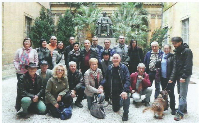
Il gruppo della Co.F.As. davanti al monumento a Gioacchino Rossini

a "Il barbiere di Siviglia" di Benoit Roland e Roberto Zamengo rappresentato da Teatroimmagine - Salzano (VE).