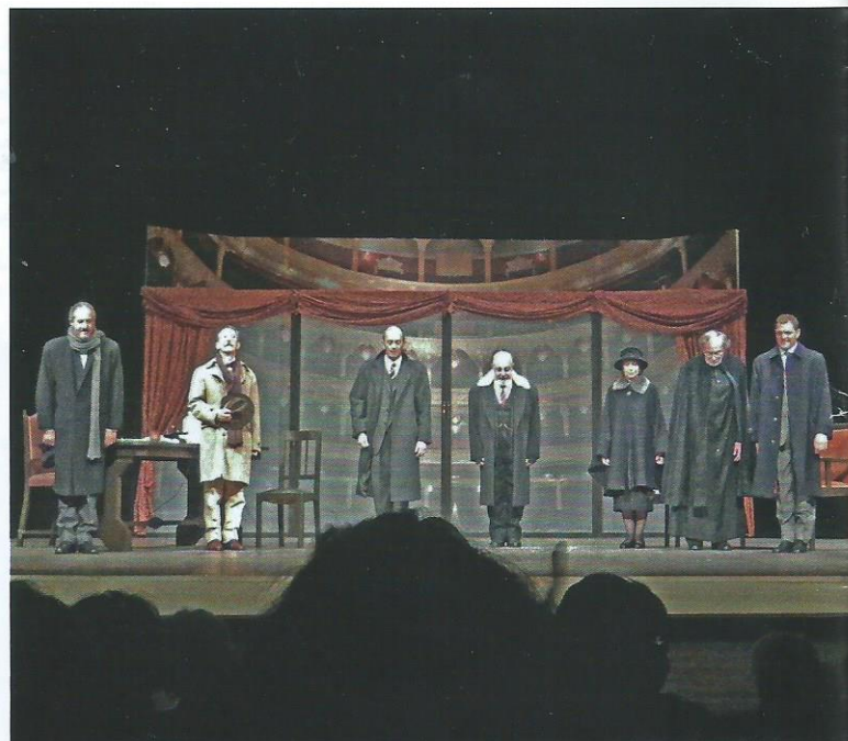
La Compagnia dell'Eclissi di Salerno alla fine dello spettacolo "L'arte della commedia"